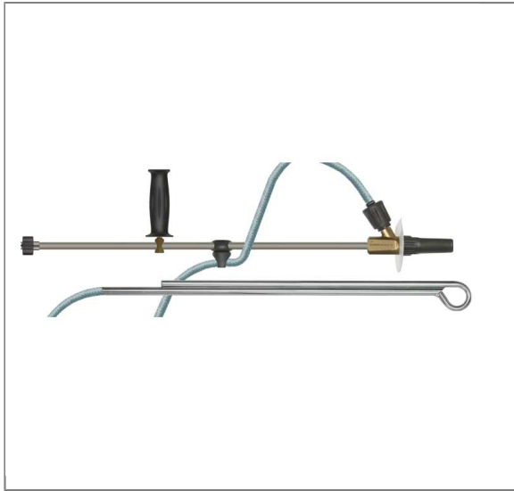
Kit de sablage ST-55