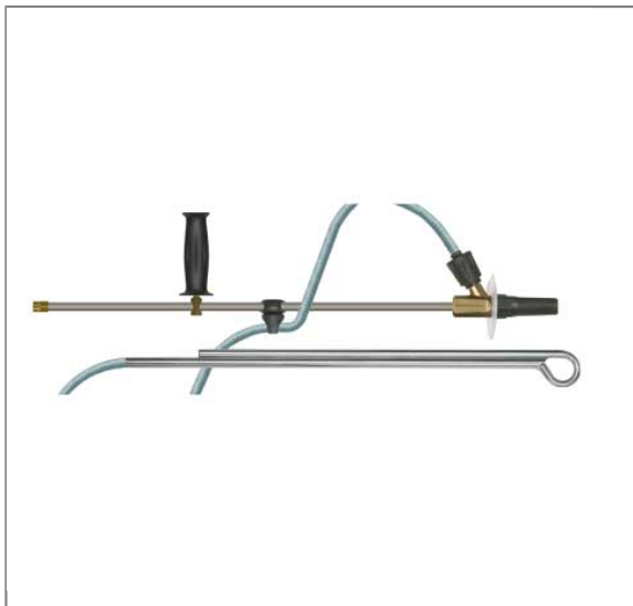
Kit de sablage ST-55