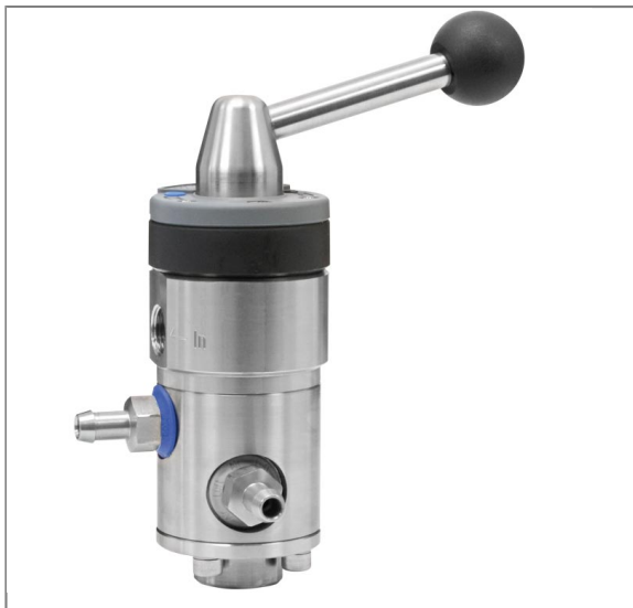
Injektor ST-162 mit Druckluftanschluß