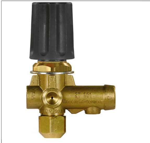
Suttner Umlaufventil ST-261

ST-261 Paneeleinbau Eingang 3/8" IG Ausgang 3/8" IG Bypass 1/4" IG Manometer 1/4" IG Max. 250 bar / 80°C / 30 l/min