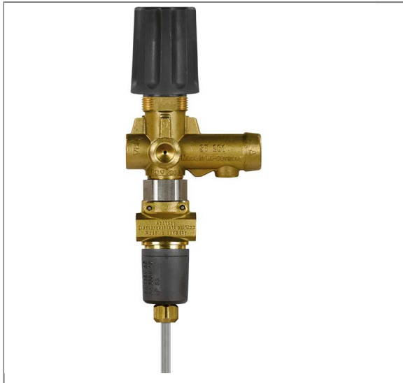
Suttner Umlaufventil ST-261