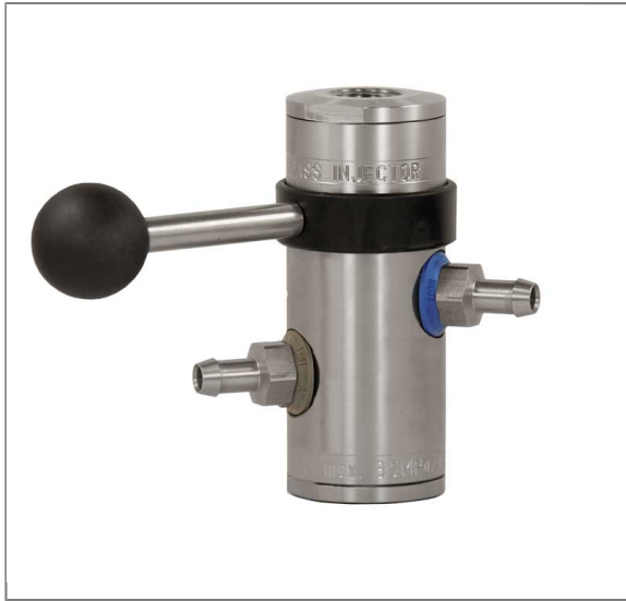
Injektor ST-168 mit Druckluftanschluß