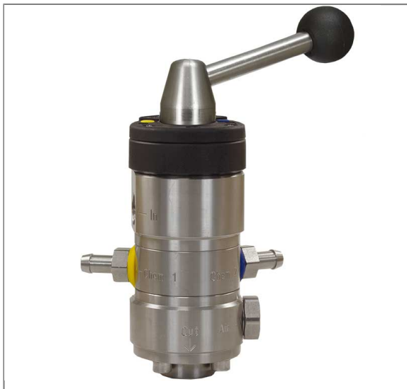
Injektor ST-164 ohne Druckluftanschluß

Eingang: 3/8" IG Ausgang: 1/2" IG Düsengröße 1,3 mm Ansaugung: 2 x Tülle 9 mm Regulierung der Chemiedosierung erfolgt durch 2 x 10 auswechselbare Dosiereinsätze (0,5 - 2,0 mm) Max. 350 bar / 100°C