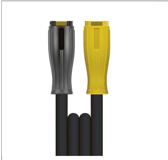
powershield365+ Nippel aus Edelstahl