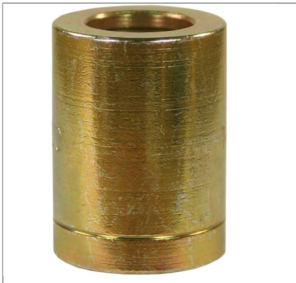
B2R04 14,2x30 mm zum schälen