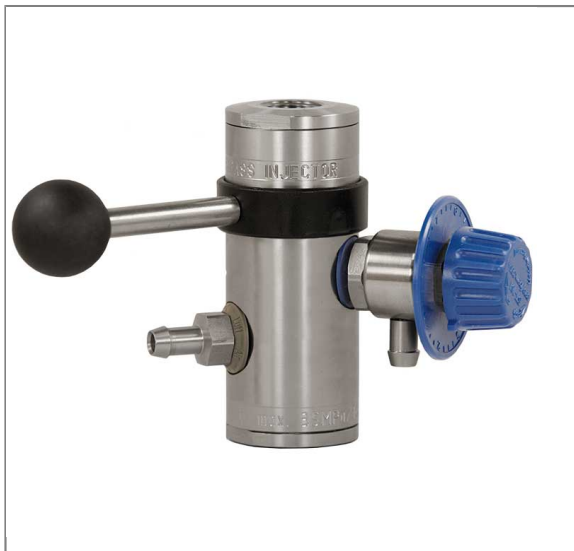
Injektor ST-168 mit Druckluftanschluß