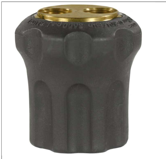
Umschaltdüse ST-56 Ausgang: 2x1/4" IG