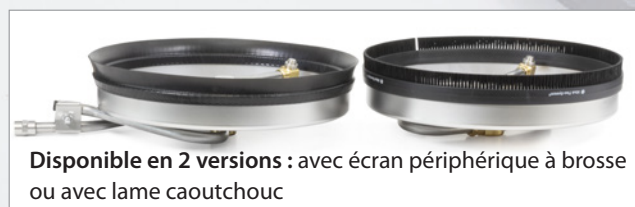
Disponible en 2 versions : avec écran périphérique à brosse ou avec lame caoutchouc