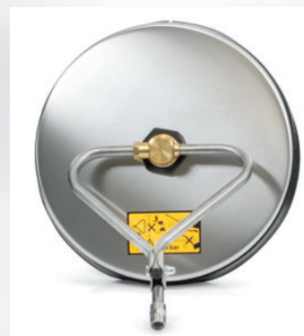
Branchement : sur bras articulé