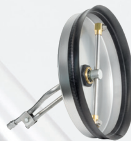
Anti vibrations : bras équilibré, construction très robuste