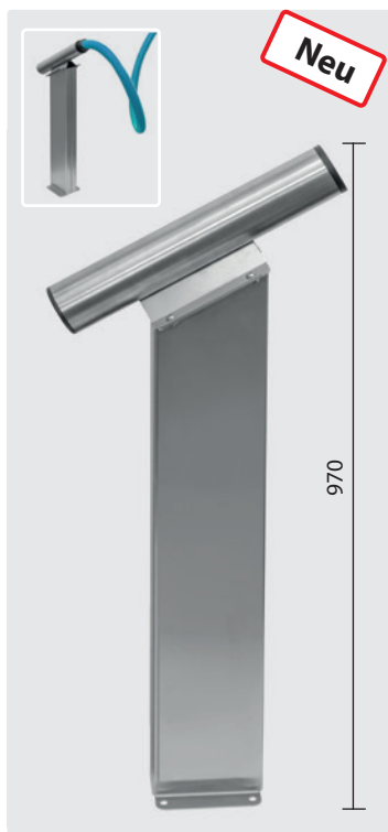
Fugendüsenaufnahme auf Säule für Bodenbefestigung, Edelstahl