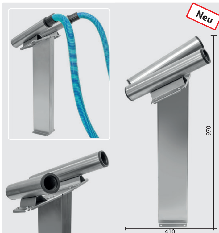
Zweifach-Fugendüsenaufnahme auf Säule, inkl. Adapterplatte, Edelstahl