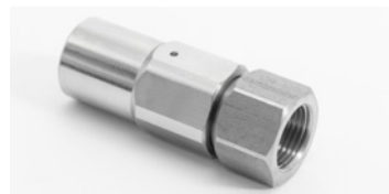
ST-303 : Equipé de roulement à billes, inox et laiton nickelé.