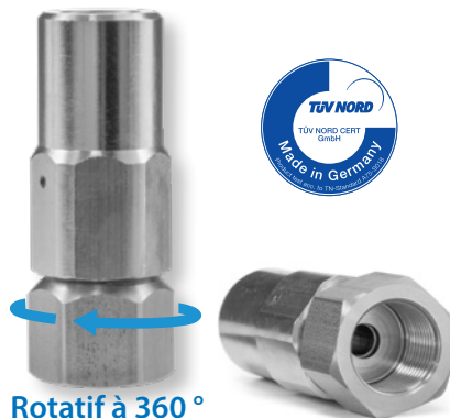
Rotatif à 360°

Adapté à toutes les applications professionnelles haut de gamme