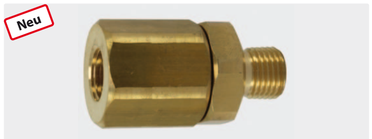
Messing mit Edelstahlsieb. Bidirektional einsetzbar. Max. 400 bar / 40 l/min. / 150 °C

Auswertungen von Umfragen, sowohl im Kundenkreis, als auch in der Anwendungstechnik ergaben, dass nahezu 80 % der Beanstandungen an Hochdruck-, Rotations- und Rohrreinigungsdüsen vermieden werden könnten, wenn direkt vor der Düse eine letzte Filtrierung des Hochdruckmediums durchgeführt würde. Dies würde zudem einen erhöhten Verschleiß in Düsen mit beweglichen Innenteilen vermeiden. Abhilfe schafft hier der Hochdruckfilter ST-33, der direkt vor der Düse installiert wird. Das Filterelement ist dabei so ausgelegt, dass es einen guten Kompromiss zwischen Druckverlust und Filterleistung bietet.