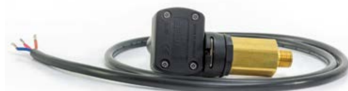
Câble électrique : Longueur 950 mm

Marquage : Un anneau rouge marque le modèle 25 bar et noir pour 40 bar.