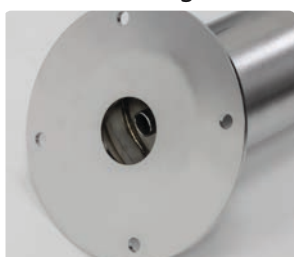
Raccordement : drain de 20 mm de diamètre